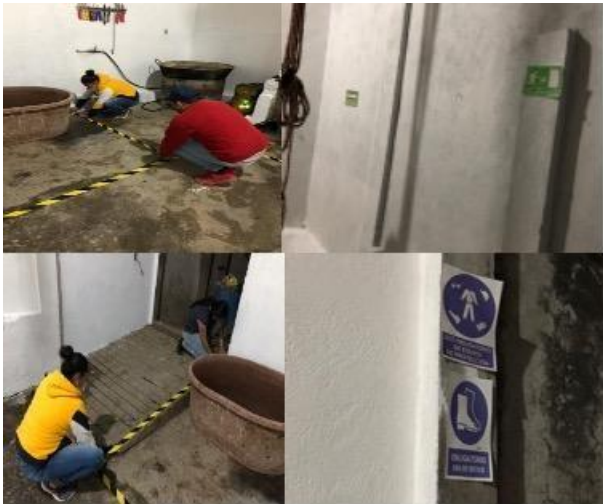
Figura 5. Aplicación de Seiketsu