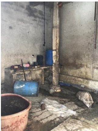
Figura 1. Área de rastro

Las instalaciones en el área de rastro se encontraron en desorden, ya que las herramientas de trabajo utilizadas para el desarrollo de tareas se encontraron dañadas, sin sitios identificados para su acomodo, además se encontraron objetos obsoletos e innecesarios en el piso como se observa en la figura 1.