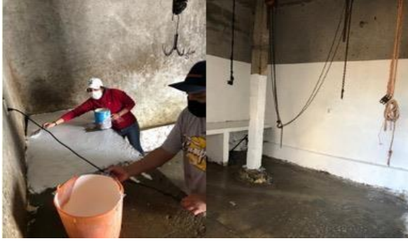
Figura 4. Aplicación de Seiso